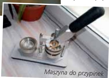
Maszyna do przypinek

komercyjne działania społeczno-kulturalne, edukacyjne, otwarte dla mieszkańców Warszawy. Każdy może dodać swój zasób, każdy może skorzystać z bazy Spółdzielni. Już teraz jest tu ponad 120 zasobów różnego typu.