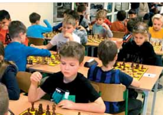
Turniej Grand Prix B

Najwyższe wyniki w kategorii rocznik 2011 i młodszy osiągnęli: