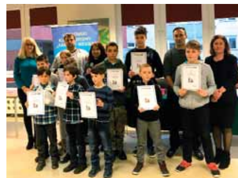
Zwycięcy Turnieju C