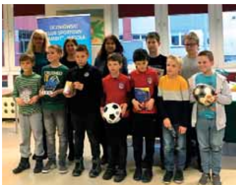
Zwycięcy Turnieju A, B