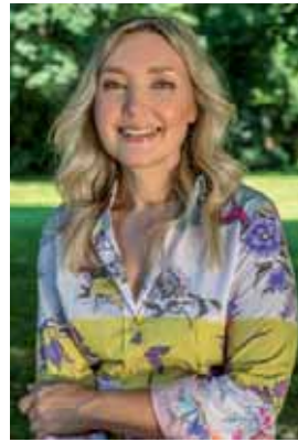
Author by Damian Deya

C jak CIERPIENIE – to negatywny stan psychiczny i emocjonalny bądź fizyczny. Cierpienie psychiczne wiąże się z doświadczaniem negatywnych emocji takich jak lęk, poczucie krzywdy, smutek czy żal.