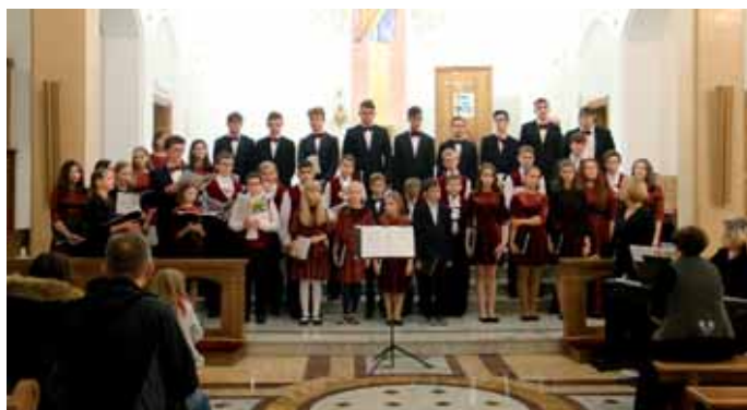
Połączone chóry Pueri Cantores z Limanowej i II Canto Magnificat z Warszawy-Wesołej podczas koncertu w parafii p. w. NSPJ – Stara Miłosna