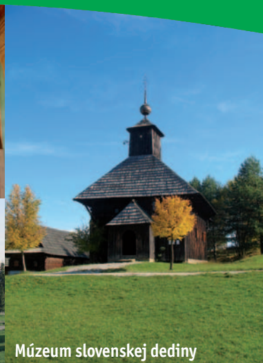
Múzeum slovenskej dediny