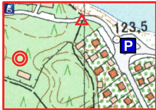
Centrum zawodów Borki