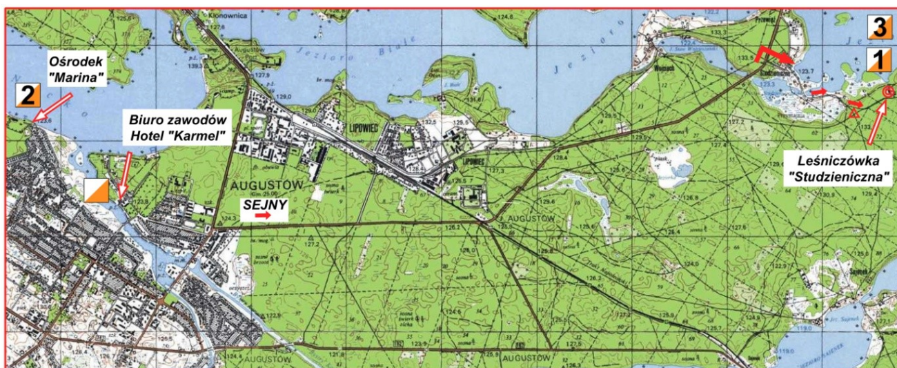
Mapka sytuacyjna zawodów.